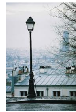
Un réverbère= lamppost